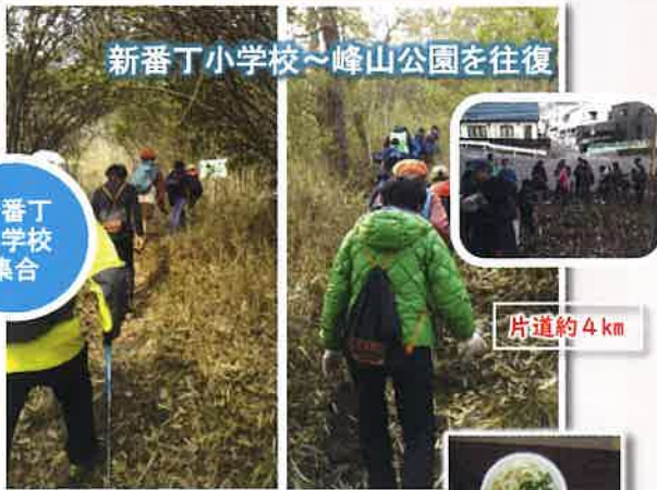
新番丁小学校～峰山公園を往復