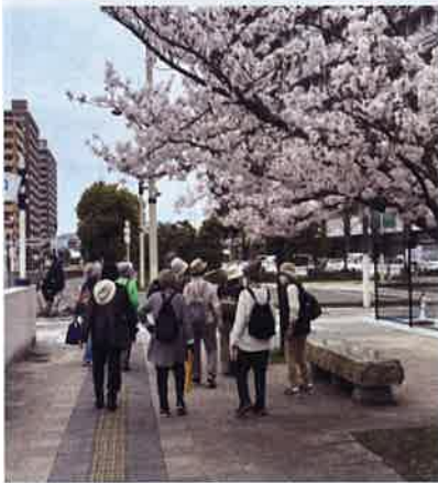
▲サンポート・高松駅周辺