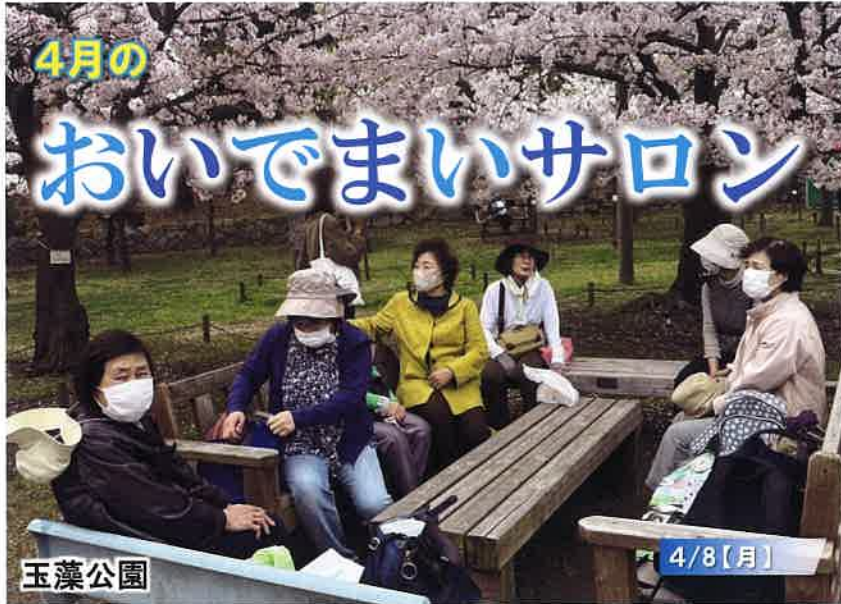
▲桜満開の玉藻公園