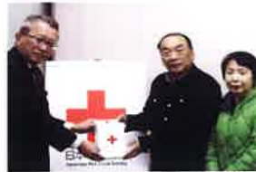
令和6年能登半島地震災害義援金 二番丁コミュニティセンター様