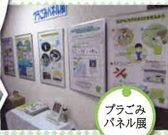
プラごみ パネル展