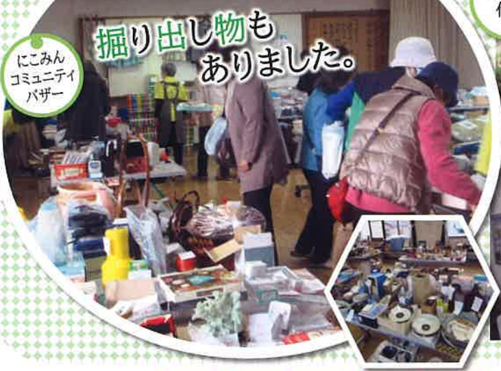
にこみん コミュニティ バザー