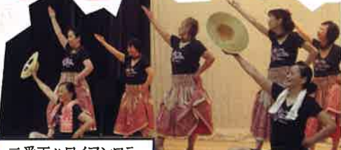
二番丁ハワイアンフラ