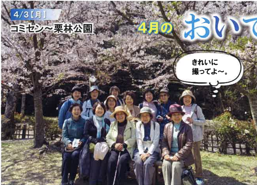
▲久しぶりの花見で桜満開の栗林公園を楽しみました。記念にパチリ！

令和5年度のおいでまいサロンは、お花見から始まりました。なかなか一人ではできない事が出来るのもこの「おいでまいサロン」の良さです。年齢に関係なく、どなたでも参加できます。春開催は5月末で終わり、10月からまた開始します。是非気軽にご参加ください。