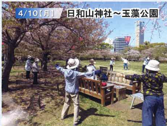
▲玉藻公園で体操をして、桜を見ながらのお弁当は会話がはずみました。