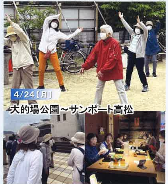
▲マリタイムプラザの上から、建設中の県立体育館を見たあとみんなで会食。大満足の日でした。