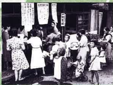
▲写真は高松ではありません

1938年(昭和13年)4月に国家総動員法の設定をきっかけに広く生活必需品が配給制となりました。1940年からは、米・味噌・醤油・マッチ・砂糖・木炭等10品目に