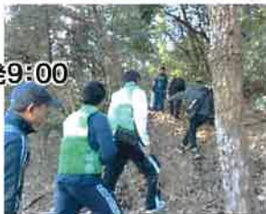
二番丁地区体育協会

新番丁小学校から峰山公園までを歩いて往復します。みんなで一緒に登ると楽しいですよ！