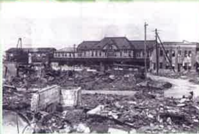
▲焼け残った木造の国鉄高松駅

高松空襲は私が二番丁小学校4年生の1945年7月4日午前2時56分から4時20分迄、116機のB29(爆音は腹に響く音でした。)